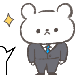
CN支援アドバイザー