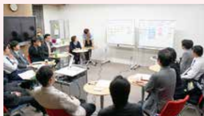
新免副社長が講師を務める社外向けセミナー「組織いきいき実践勉強会」も第5期に突入

議論を尽くして全社員が納得したことに、それほど大きな間違いはないと考えています。もちろん、新しい取組は2カ月後の全体会議で評価し、見直しています。新しい取組には時間も手間も無茶苦茶かかります。けれども、「会議での話し合いを踏まえ、最終決定は社長」とか稟議書を回すことでは、社員のモチベーションを高められないでしょう。決定権を与