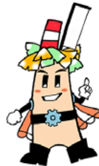
中小企業応援キャラクター「すくすくん」

対象:物品の製造(加工を含む)、修理、情報成果物の作成または 役務提供(建設業を除く)を業とする事業者の発注担当者等 各会とも時間は13:30~16:30 受講料:無料