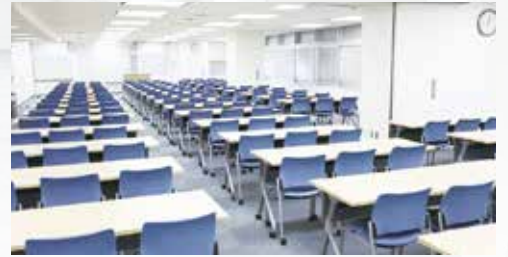
第1会議室+第2会議室