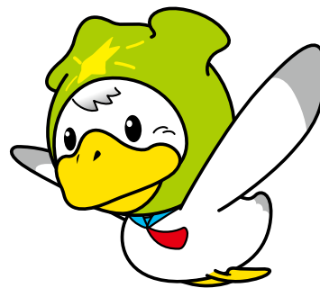
イメージキャラクター「カナモ」

神奈川県信用保証協会は、中小企業の皆さまが金融機関から事業資金を借入するときの「公的な保証人」となり、資金調達をサポートします。今回は、当協会が取り組む「経営支援」をご紹介します。