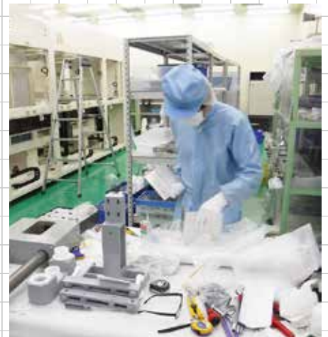
大型精密部品洗浄装置