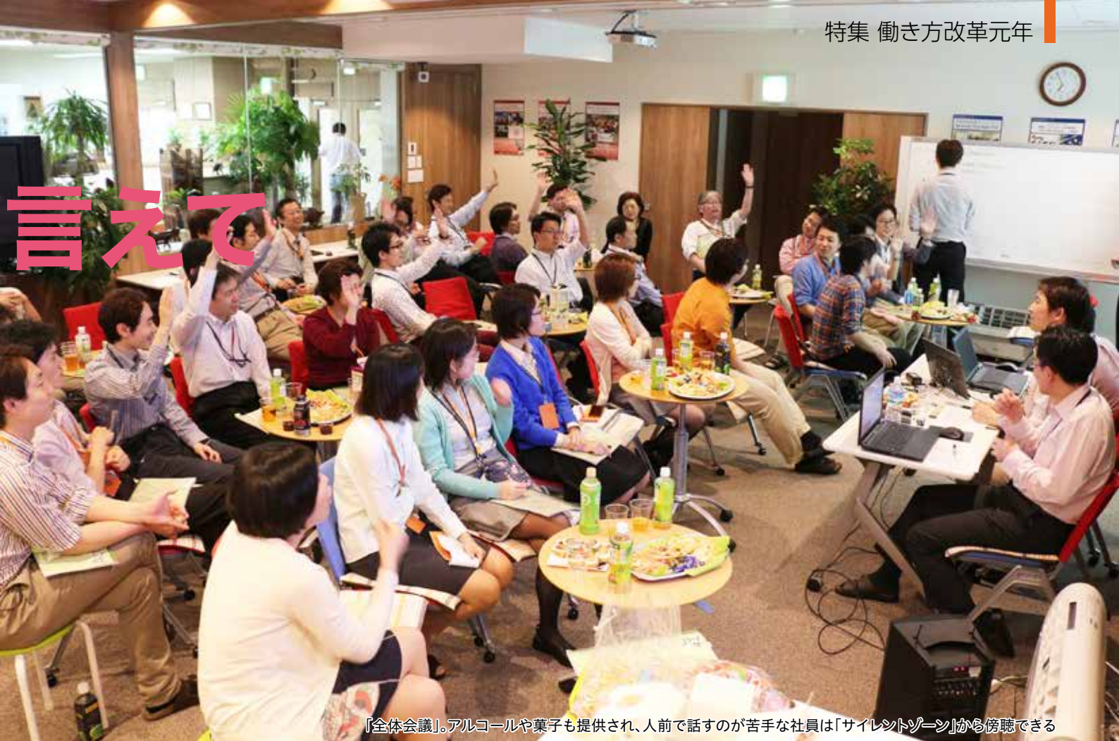
「全体会議」。アルコールや菓子も提供され、人前で話すのが苦手な社員は「サイレントゾーン」から傍聴できる