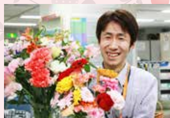
「花一輪」。社員の誕生日に、すべての社員から花を一輪ずつ贈る習慣