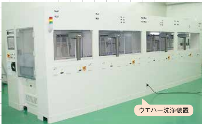
ウエハー洗浄装置

これまでの半導体製造装置洗浄業界では、枝葉洗浄(1枚1枚のウエハーを薬液や水で繰り返し洗浄する構造)が主流でしたが、この洗浄方法は、表面洗浄時は裏面を洗えないといった課題がありました。そこで、当社はバッチ洗浄(1度に何十枚もウエハーを洗浄することができ、表面と裏面の両面を沈めて洗浄するため、洗浄効率が非常に高い洗浄方法)ができる装置を開発し、販路拡大を目指しています。