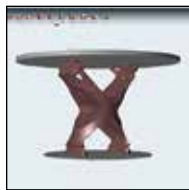
図2 トポロジー最適化結果例