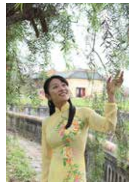
アオザイ試着体験