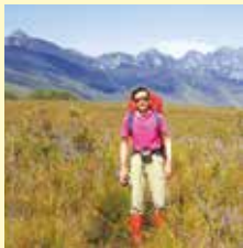
タスマニア、フェデレーションピーク往復100kmに2週間かけて単独登頂(2006年)

昭和、平成をほぼ30年ずつ生き、令和の始まりとともに、中小企業の皆さまのお手伝いという新たな役割に全力で取り組んでまいります。