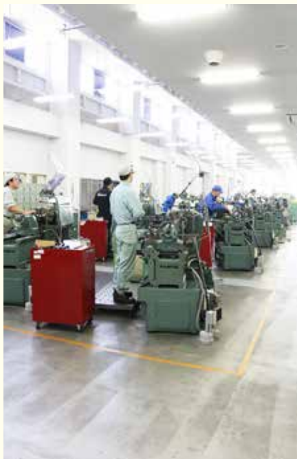
ピカピカに磨かれた汎用旋盤30台がズラリ! 5Sが徹底されていて、ちり取りまで拭いて片付けるんだって!