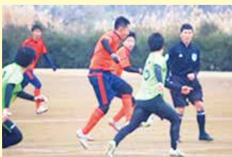
川崎信用金庫のサッカー部に所属(写真中央)

川崎信用金庫で10年の支店(3店舗)勤務を経た後、今年4月より神奈川産業振興センターへ出向しています。中小企業の皆さまと「Face to Face」で経営課題を解決し、神奈川から日本を、より元気にしていく原動力となれるよう、KIP職員の方々と共に中小企業を支援したいと考えています。また、KIPに在籍する多数の専門家のネットワークを活用し、経営課題の発見力、課題解決力を学びたいと思います