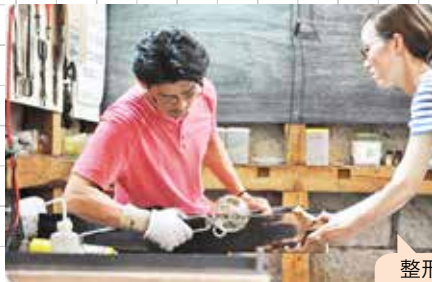
整形の工程。素早さと二人の息を合わせる事が求められる

大正時代の石蔵を改造した、レトロな雰囲気の自社ガラス工場の完成がこの取組みのきっかけとなりました。鎌倉や横浜のレンタル工房に通っての作品づくりから、自社工房での作品づくりへと環境が変わり、作品の生産量が増大したことに加え、口コミ等で吹きガラス体験客も増加していったため、売上拡大のチャンスと判断し、店舗を改装しました。