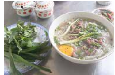
日越ヌードル・フェア