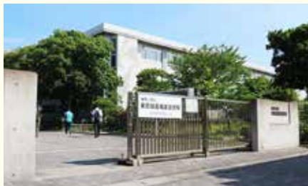
JR鶴見線 安善駅から徒歩1分の東部校。横浜スタジアム約1.5倍の広大な敷地に充実の設備が整っています