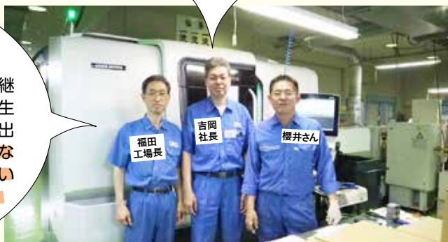
ミクロンオーダーの精度に応える精密部品製造の(株)吉岡精工 www.yoshioka.co.jp/ TEL 045(500)1363