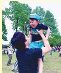
保育園の親子遠足にて長男と

金融機関での経験及びKIPに在籍する多数の専門家ネットワークを利用し、全力で中小企業の皆さまの課題解決を支援し、神奈川県の実現に努めてまいります。