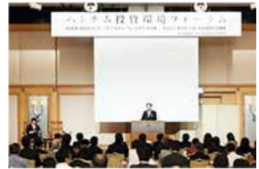
昨年のベトナム投資環境フォーラム