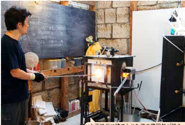
大正時代に建てられた蔵の雰囲気が残る工房で。窯で溶解したガラスの温度は1,270度

小規模事業者持続化補助金を活用した「小田原に新たな吹きガラス文化を根付かせる体験・展示施設の整備事業」です。海が見渡せる立地を活かして、17坪程のスペースを吹きガラス体験の待合場所を兼ねた売場に改装し、オリジナル作品をふんだんに展示したモダンな店に仕上げることで、事業を伸張させました。