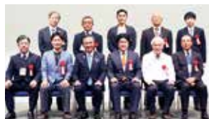
神奈川県知事と前回の受賞者の方々