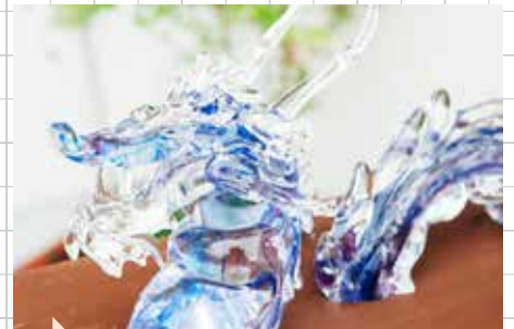
龍が泳ぐ姿を水面から上のみ制作したオブジェ