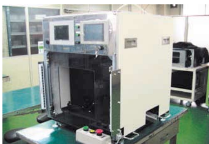
異物混入画像検査装置