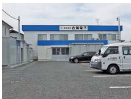
平成29年3月新社屋移転