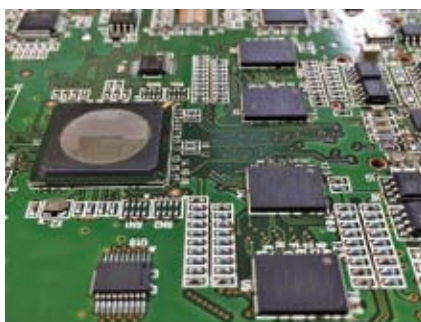
高度技術者による基板改造・基板改修