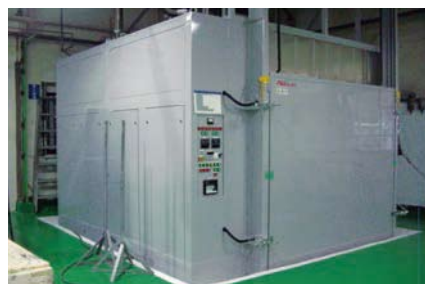
新設バッチ式大型ガス炉