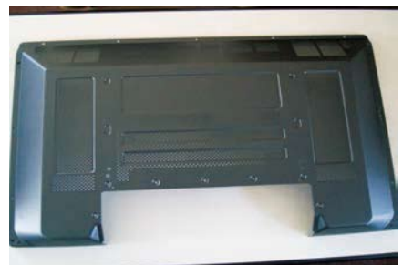
55インチテレビのバックカバー