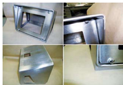
鉄道運転台のモニター