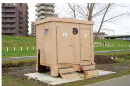
多摩川河川敷にあるトイレ本体すべてステンレス (塗装)