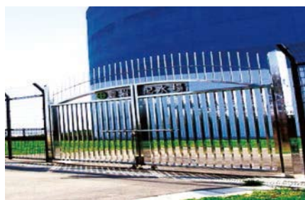
秋田市の浄水場にあるステンレス門扉 (400 研磨)