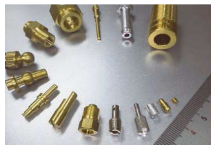
各種金属の精密切削部品