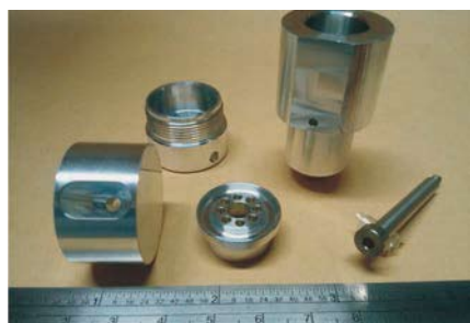
自動盤内の六角穴加工や楕円深穴加工等