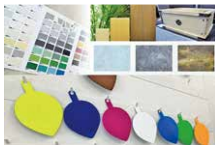
焼付塗装 / 粉体塗装 (木目調やエイジング調塗装も可能)