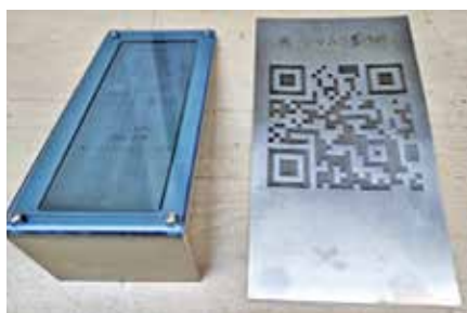
名札立て / QRコード (弊社HP) (小物製作も可能)