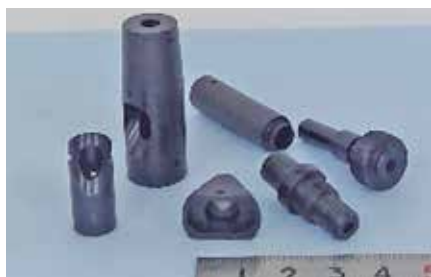
医療関連部品 (内視鏡等)