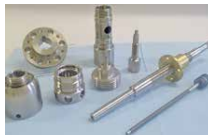
試作部品関係、各種金属加工品 (切削、研削加工)