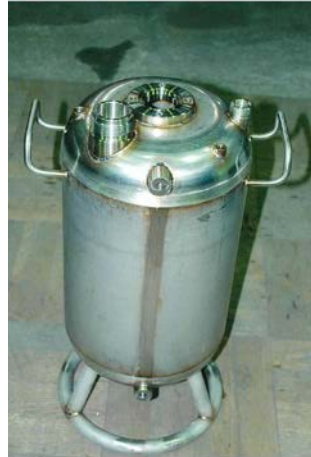
水タンク(防衛産業向け) SUS304 4t本体胴 Size 胴部 φ350xH550