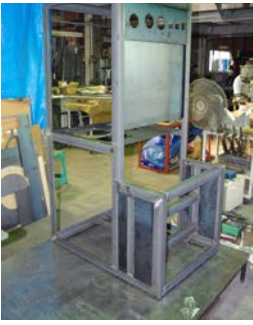
SSアングル材 フレーム t5x40他 700x950xH1650