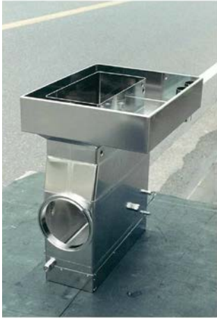
超音波洗浄槽 SUS316L 1.5t Size 850x600x900 バフ研磨後電解研磨、不動態処理