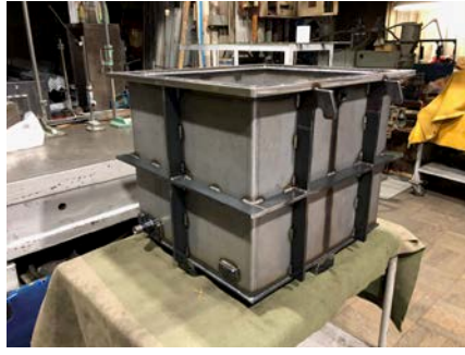
電子銃用絶縁トランスタンク SS400 表面処理前 630x570xH510