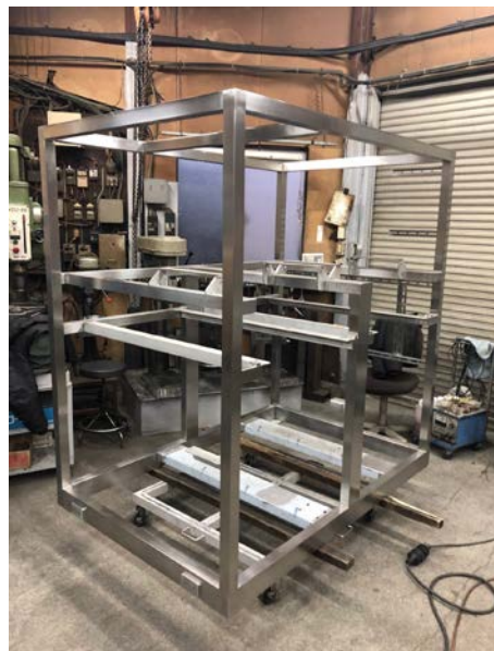
SUS304角パイプ溶接製フレーム