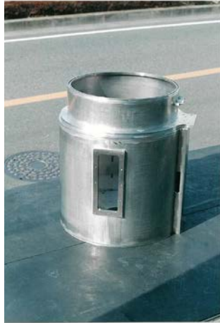
チャンバー(半導体製造装置) SUS304 4t本体胴 Size 650x650x900