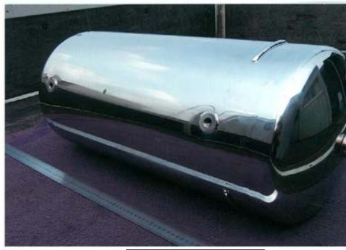
水タンク(防衛産業向け) SUS304 6t本体胴 Size 胴部 φ350xL800 酸洗後、バフ研磨#400 水漏れテスト有