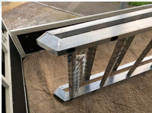
特殊車両用 アルミ階段の溶接