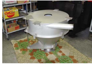
サイクロン(食品設備)SUS304 φ800xH803