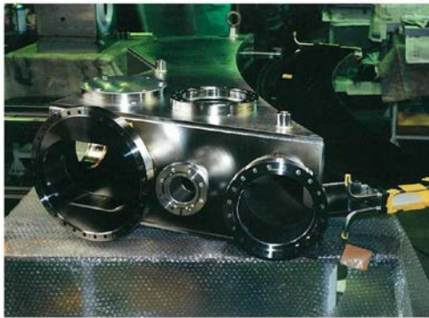
大型放射光施設ビームライン 真空チャンバー-SUS316L Size 1500x1200x H300