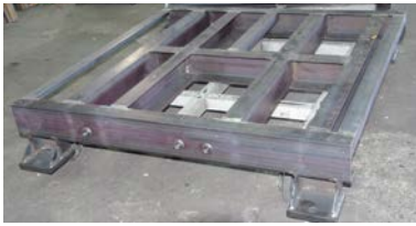
ポンプ架台 SSチャンネル材125x65x6t他 1200x1200xH225

神奈川県相模原市中央区溝野辺1-21-7 TEL 042-754-1765 FAX 042-755-2266 URL: www.koyama-yousetsu.co.jp k-kazutoshi@koyama-yousetsu.co.jp