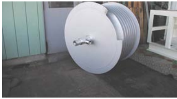
ホースリール SUS304 φ700x幅485 軸φ60