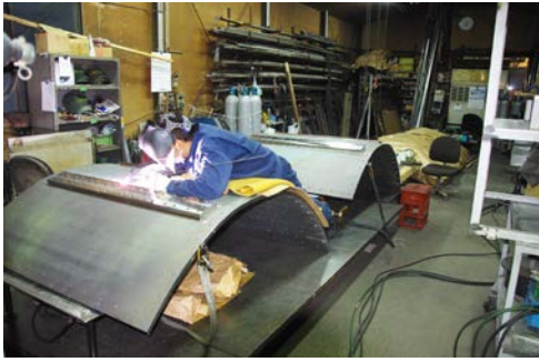
チタン電極の溶接