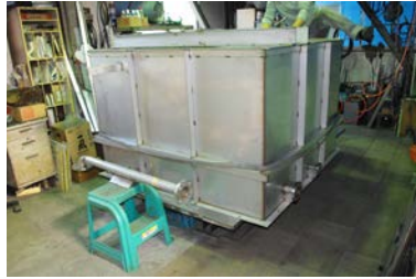
汚泥槽(水処理施設)SUS304 1800x1800xH1350