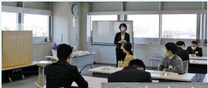
ビジネスマナー研修開催の様子

研修には合計で12社22名が参加し、社会常識やルール等を学びました。グループごとに分かれさまざまなグループワークを行いました。参加後のアンケートでは、「電話対応や名刺交換は、研修を会社で受けていても、不安な部分で、作法や敬語が本番で飛んでしまうことがあったため、対面の本研修で直接教えていただけて良かったです。」「チームで話し合いをして行動に移すという事や目標を決めてその達成に向けて協力することの大切さを実感できた。」といったお声をいただきました。