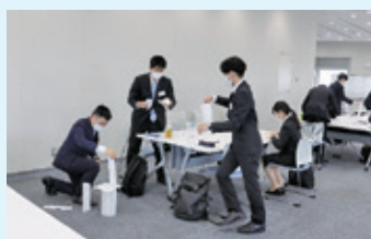
グループワークの様子