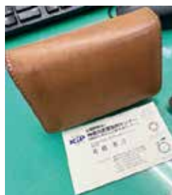
マザーハウスの名刺入れ

現在、日本での外国人材の受け入れ先は、東南アジア諸国から南アジアの「バングラデシュ」へと急速に広がりを見せています。1億7,000万人の人口を抱え、平均年齢は約28歳。この若く活力に溢れた国は、日本の産業界を支える「ポスト東南アジア」の最有力候補として、今まさに大きな注目を集めています。