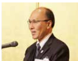
前田副知事の祝辞