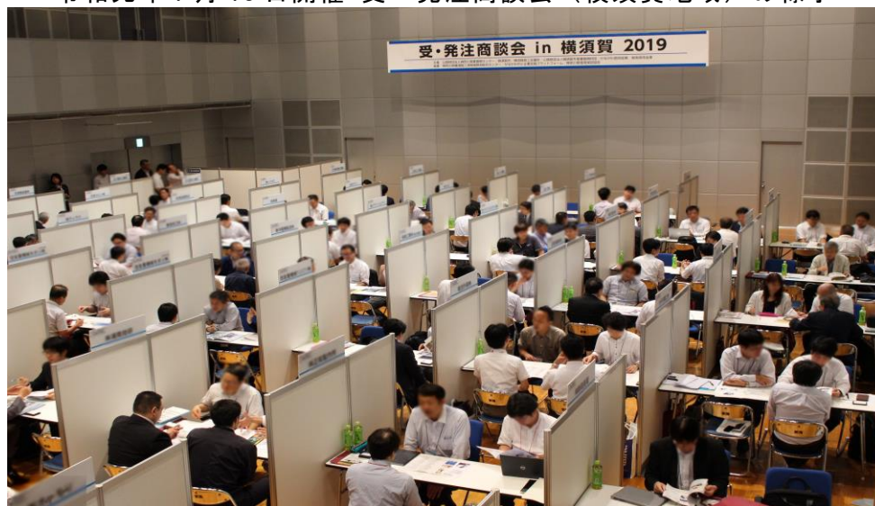
令和元年7月18日開催 受・発注商談会(横須賀地域)の様子