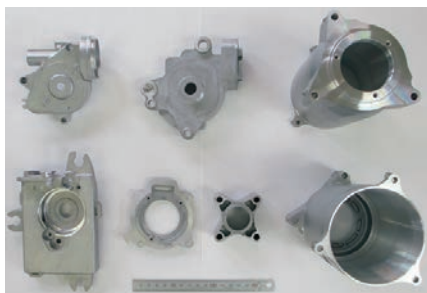
アルミダイカスト製品の切削加工