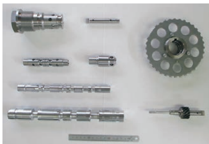
各種鋼材の切削加工及び組立製品