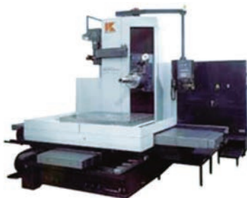
倉敷機械 (株) 製 KBT-11A